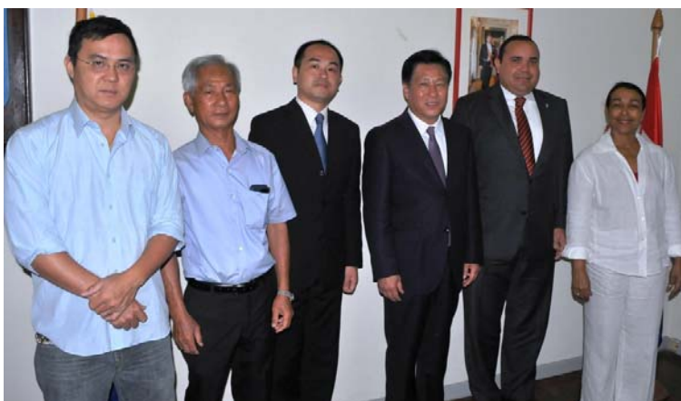
Foto: Gezaghebber en Eilandsecretaris met de delegatie van de Volksrepubliek China